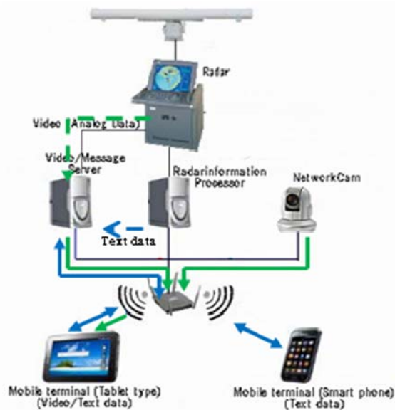
Fig.1 Structure of information sharing system on board

通信はIPベースとし、通常のモバイル端末のアプリの一つとして動作させることとした。